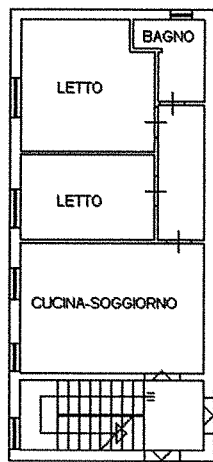
PIANO PRIMO h. 2,70