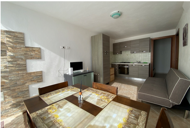
SOGGIORNO CON ANGOLO COTTURA