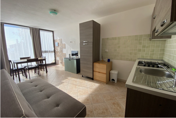
SOGGIORNO CON ANGOLO COTTURA