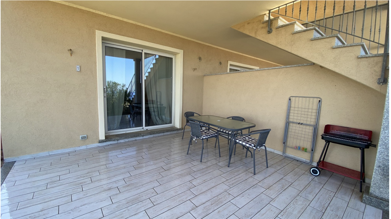
Spaziosa veranda vista mare