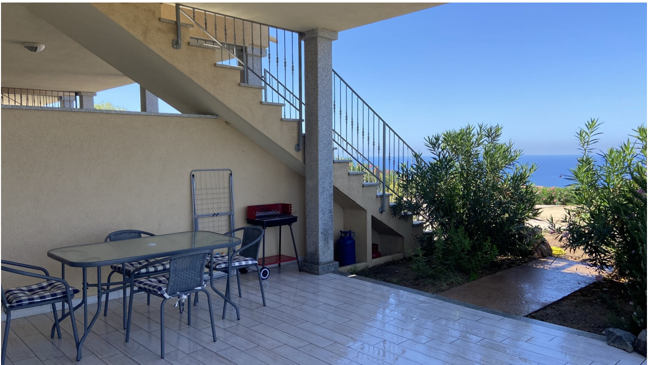
Spaziosa veranda vista mare