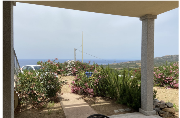
Veranda + tratto di giardino privato