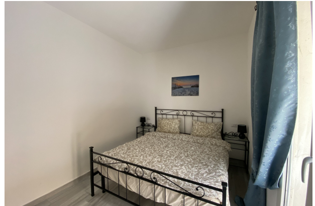
Camera da letto matrimoniale