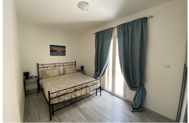
Camera da letto matrimoniale