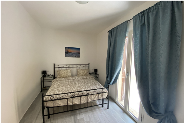
Camera da letto matrimoniale