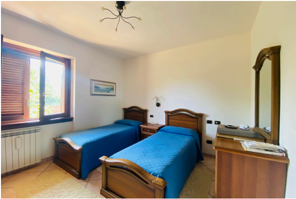
CAMERA DA LETTO 1