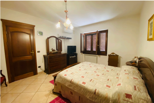
CAMERA DA LETTO 3