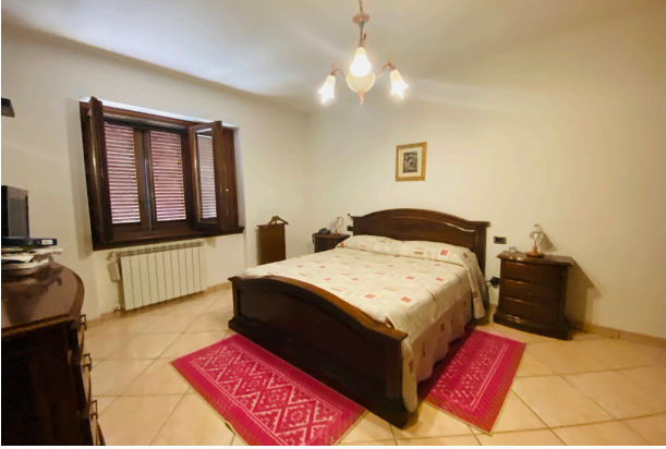
CAMERA DA LETTO 3