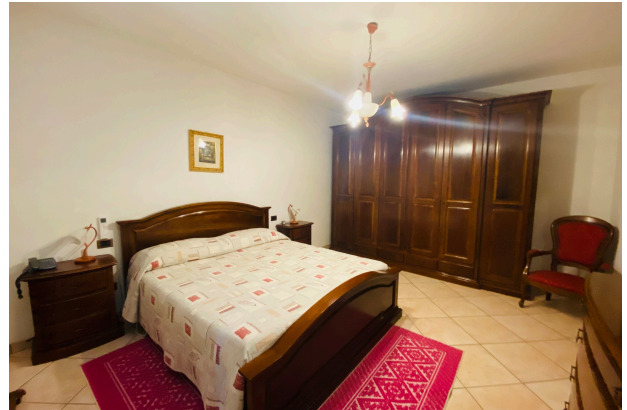
CAMERA DA LETTO 3