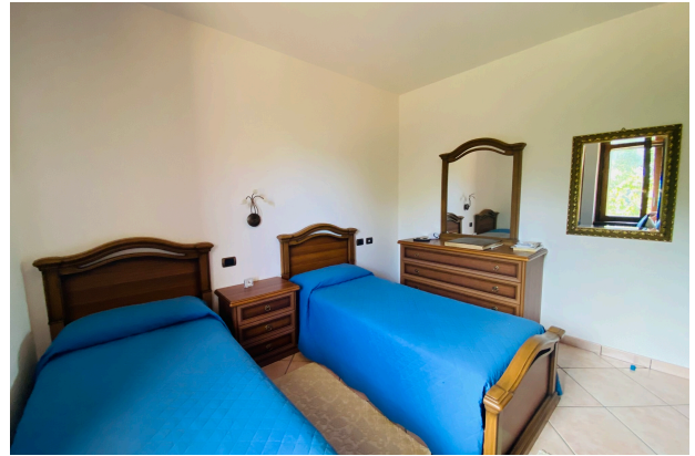
CAMERA DA LETTO 1