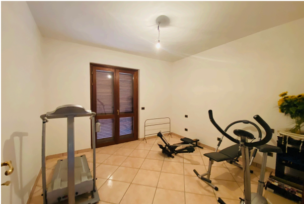
CAMERA DA LETTO 3