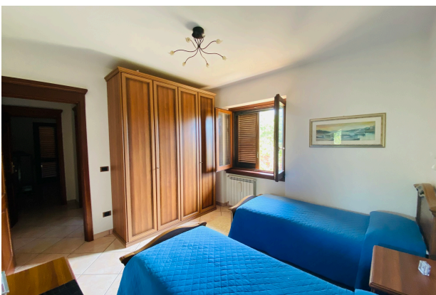
CAMERA DA LETTO 1