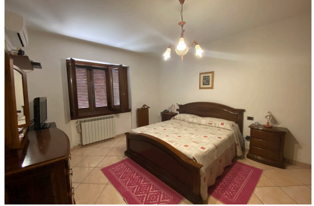
CAMERA DA LETTO 3