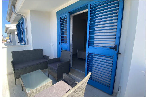
Veranda primo piano