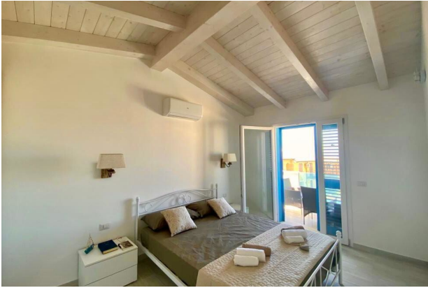
Camera da letto 1