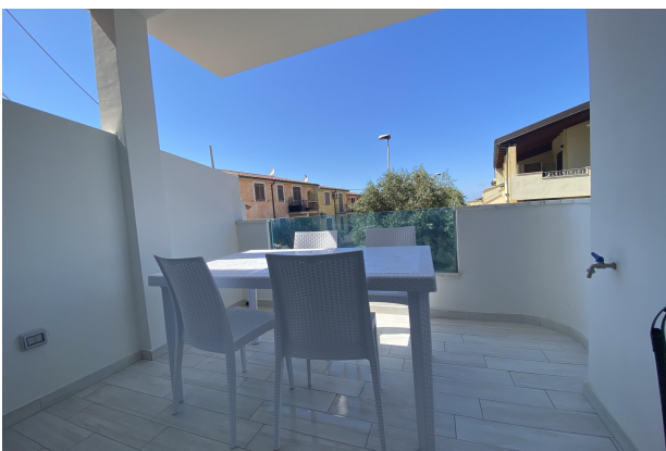
Veranda piano terra