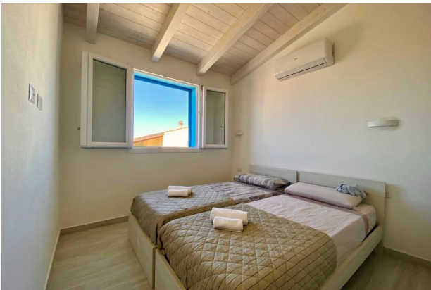
Camera da letto 2