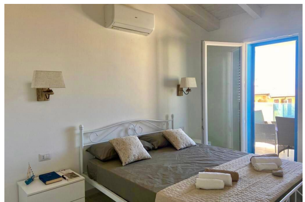
Camera da letto 1