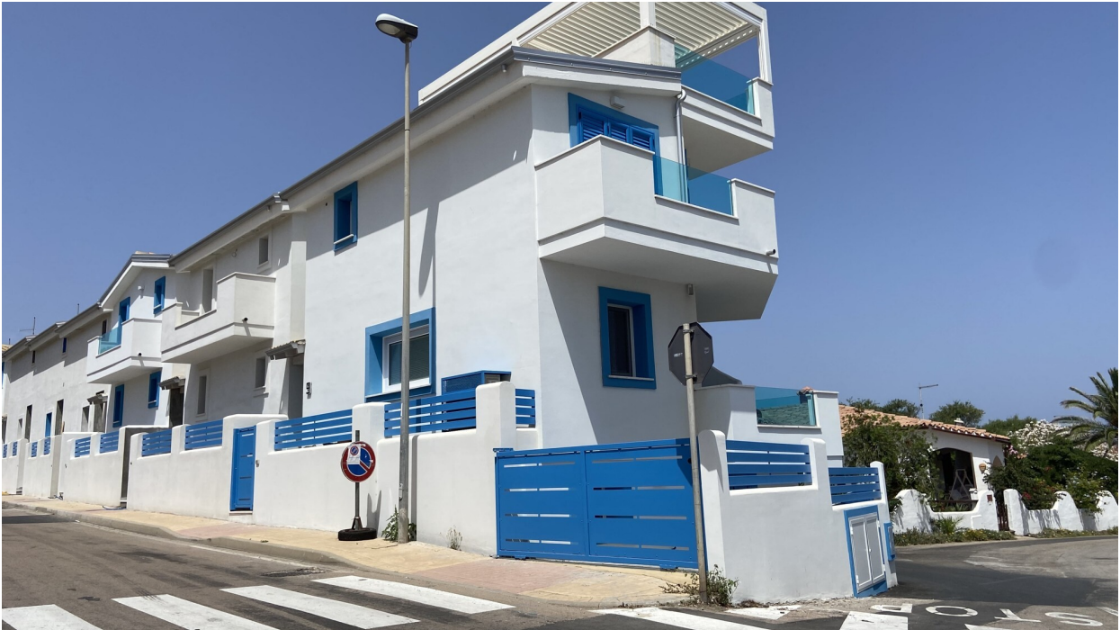
Complesso residenziale 'Ville Turchese'