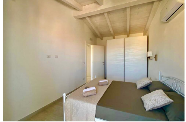
Camera da letto 1