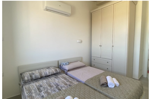
Camera da letto 2