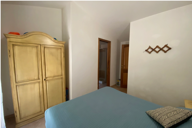
Camera da letto 1