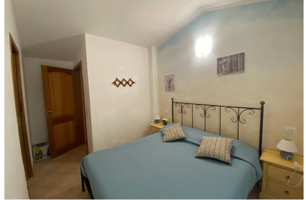
Camera da letto 1