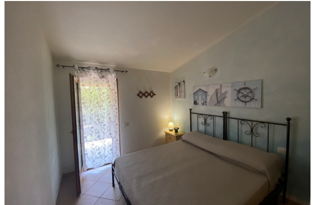
Camera da letto 2