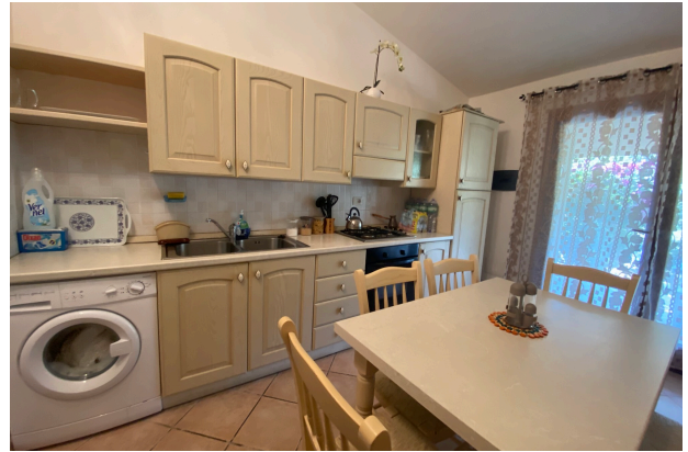
Soggiorno con angolo cottura