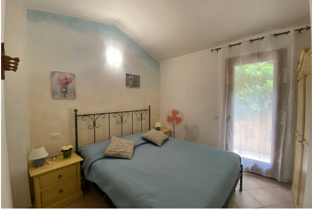
Camera da letto 1