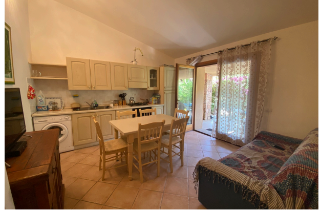
Soggiorno con angolo cottura