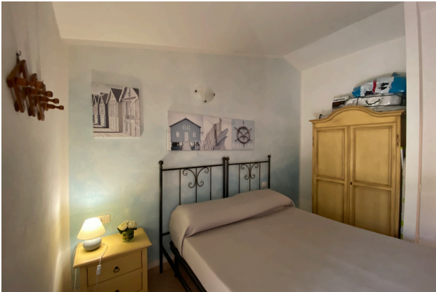
Camera da letto 2