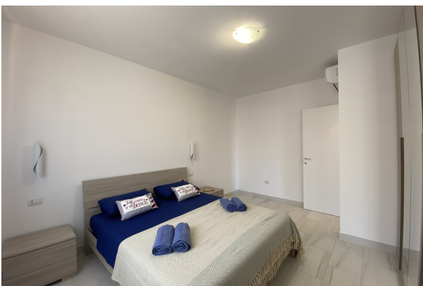
Camera da letto matrimoniale