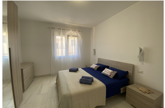
Camera da letto matrimoniale